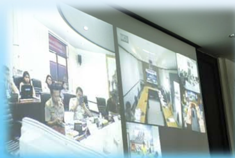
ผลการดำเนินงานงบประมาณโครงการ (ตามงานโครงการกลุ่มจังหวัดภาคเหนือตอนบน ๑) (รายการ) จารระบบ PADME