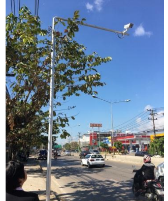
รูปที่ ๓-๕ การลงพื้นที่ติดตามโครงการฯตามจุดต่างๆที่ติดตั้งกล้องโทรทัศน์วงจรปิดอัจฉริยะ (Smart CCTV) ในจังหวัดเชียงใหม่