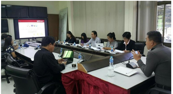
รูปที่ ๑-๒ การประชุมหารือติดตามโครงการฯระหว่างตำรวจภูธรจังหวัดเชียงใหม่และทีมงานสำนักบริหารยุทธศาสตร์กลุ่มจังหวัดภาคเหนือตอนบน ๑